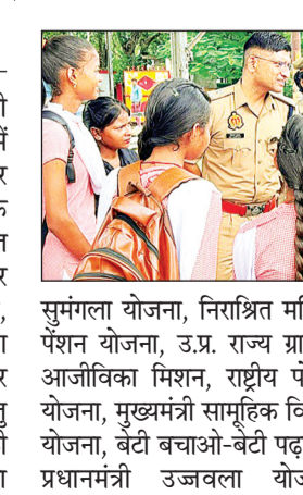
सुमंगला योजना, निराश्रित महिला पेशन योजना, उ.प्र. राज्य ग्रामीण आजीविका मिशन, राष्ट्रीय पोषण योजना, मुख्यमंत्री सामूहिक विवाह योजना, बेटे बचाओ-बेटे पढ़ाओ, प्रधानमंत्री उज्वला योजना,

योजना, मुख्यमंत्री अयुधय योजना, कन्या सुमंगला योजना, महिला ई-हाट योजना तथा विभिन्न हेल्पलाइन नंबरों वीमेन पावर लाइन 1090, पुलिस आपातकालीन सेवा-112, सी0एम0 हेल्प लाइन 1076, स्वास्थ्य सेवा हेल्प लाइन-102, एम्बुलेंस सेवा-108, महिला हेल्प लाइन-181, साईबर क्राईम हेल्प लाइन 1930 आदि की जानकारी देकर जागरूक किया गया। छात्राओं को बताया गया कि किसी भी प्रकार की मदद के लिये पुलिस/डायल-112 को सूचित करें।