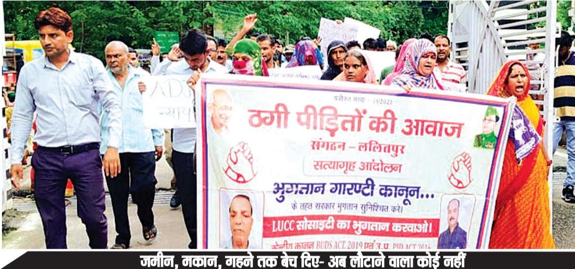
पीड़ितों ने बताया कि उन्होंने बच्चों की शिक्षा, विवाह, इलाज और आवास के सपने संजोते हुए अपनी जीवन भर की पूंजी एल्यूमीनीय में निवेश की। लेकिन जब वक्त आया जैसे लौटाने का, तब सोसाइटी ने कार्यालय बंद कर दिया और आरोपी फरार हो गए।