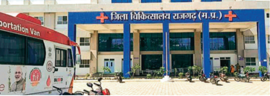
हरिभूमि न्यूज़ ॥ ब्यावरा-राजगढ़